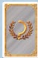
• 5 objectifs «Quartier»