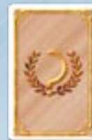
• 5 objectifs «Zone»