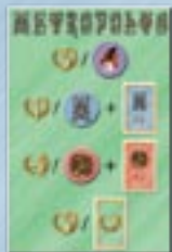
• 1 aide de jeu