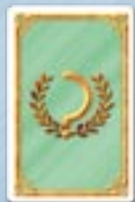
• 4 objectifs «Zone»